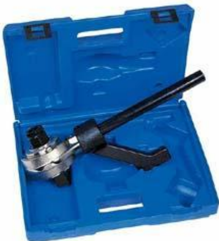
800655 Momentförstärkare \frac{3}{4} " – 1"