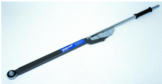
800400 Momentnyckel 150 – 700 Nm \frac{3}{4} " Utbytbar 4-kantstapp 800409