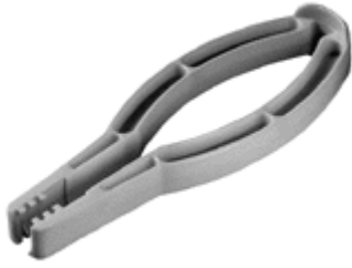
L51500 Tändkabelverktyg greppar över gummihylsan