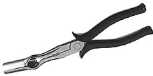
KL 127-5 Tändkabeltång vinkalt grepp 30°