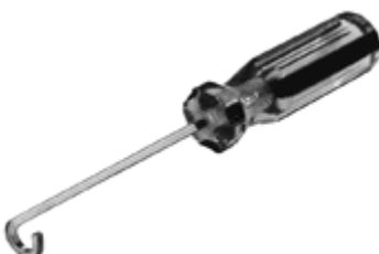
L51250 Tändkabelverktyg greppar nedanför gummihylsan.