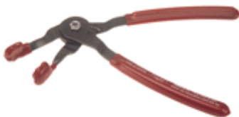
L51750 Tändkabeltång greppet kan ändras vänster, höger, rakt.