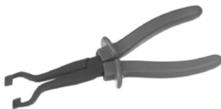
KL 127-9 Tändkabeltång för Audi, VW, BMW, Opel m.fl.