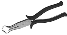
KL 127-7 Tändkabeltång med runt grepp som greppar bra över värmeisolerade kabelskor.

Observera att av säkerhetsskäl skall tändkablar ej lossas på gående motorer.